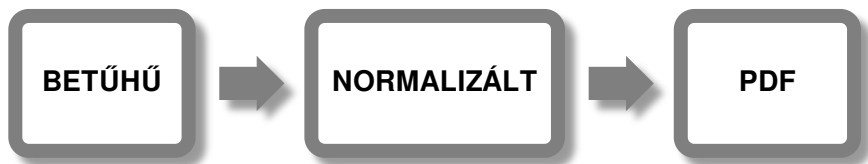
2. ábra Az átírás fázisai és formátumai

A 16–17. századi alkorpusz kialakításakor figyelembe vettük a meglévő magyar nyelvű történeti korpuszok, valamint a nemzetközi orvosi nyelvi szövegtárak kialakítási és átírási elveit is, 16 majd saját szabályzatot alakítottunk ki a többkörös átírási folyamatok szervezésére és rendszerezésére. 17 Elsődleges feladat az eredeti szövegek betűhű, valamint normalizált átíratainak az elkészítése, ami alapfeltétele a nyelvtechnológiai feldolgozásnak is. Ezen munkafázisokat követően válik majd lehetségessé a korpusz honlapjának és keresőjének létrehozása. A tervek szerint az egyes kéziratokat PDF-formátumban is elérhetővé szeretnénk tenni (lásd 2. ábra) annak érdekében, hogy a kutatók teljességében is hozzáférjenek az egyes korai munkákhoz. 18 Így kutathatóvá válik például a helyesírás, az írásjelhasználat, a szövegbeli elrendezés és számos más jelenség is. A továbbiakban az átírási és a nyelvtechnológiai feldolgozás lépéseit egy kéziraton, a Mindenféle orvosságoknak rendszedése (MOR) alapján ismerhetjük meg.