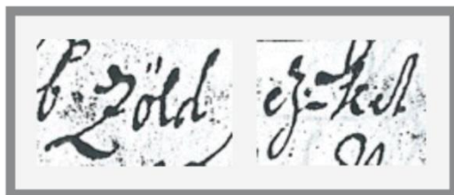
4. ábra A z graféma variánsai a szövegben

A betűhű átírat létrehozása során a nyelvészeti forráskiadás gyakorlatához igaz- zodva (Benkő 1972) készítettünk el egy graféma- és ékezetű átíratot, amely bizo- nyos mértékben paleográfaiailag is hű (Bak 2000). A szövegűség elvét szem előtt tartva a grafémák egységesítését redukáltuk a mellékjel nélküli betűvariánsokra. Abban az esetben, ha egy (mellékjel nélküli) betűnek két vagy annál több jele volt a szövegben, s bizonyosak lehettünk, hogy ezeknek nincs hangértéket megkülönböz- tető funkciója, a különböző variánsok helyett csak egyet, a ma használt grafémát vezettük be. Ezt a megoldást alkalmaztuk a szövegben három különböző betűvel jelölt s vagy a két variánsban előforduló z esetében is (lásd 4. és 5. ábra).