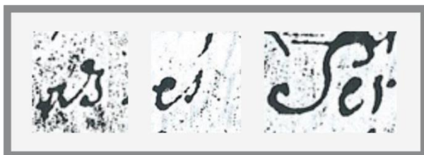
5. ábra Az s graféma variánsai a szövegben

A szöveghűség elvét a nagy- és kisbetűk használata esetében is érvényesítettük, valamint megőriztük a szöveg eredeti tagolását és írásjeleit. A nyelvemlék fizikai állapotának romlása következtében a betűk helyenként elhalványodtak vagy egyáltalán nem láthatók. A kopást, illetve más sérüléseket a szövegben minden esetben jelöltük és jegyzettel láttuk el a nyelvészeti forráskiadás elveinek megfelelően (Benkő 1972). A sérült részeket nem pótoltuk vissza a szövegbe, ugyanakkor a jegyzetben feltüntettük, hogy milyen szövegelem hiányozhat, amennyiben az kikövetkeztethető volt.